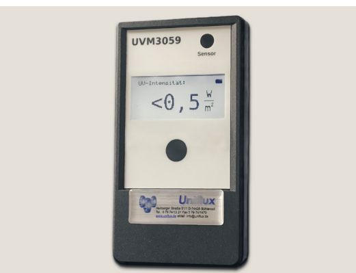
UV-Intensitäts-Messgerät mit grafischer Digitalanzeige

Besuchen Sie unsere Website und finden Sie viele weitere Produkte zum Thema: